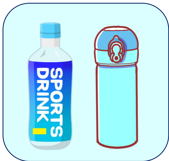
ふたが完全にしまる飲み物