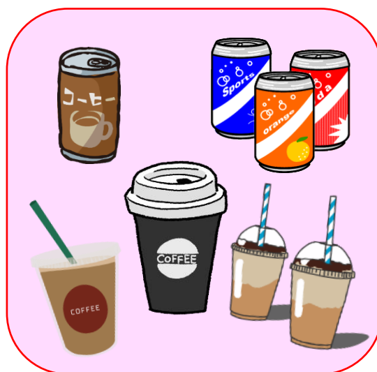
ふたが完全にしまらない飲み物