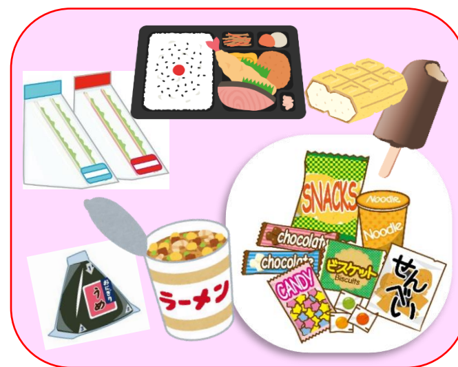
原則施設内での食事の禁止